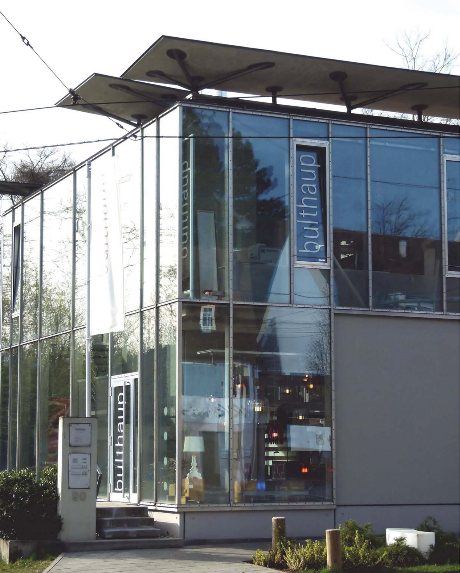
bulthaup form + funktion nürnberg